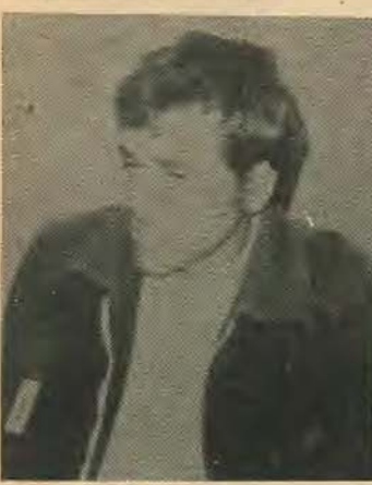
Νομίζω εννεο γεαλιμος να πουν εντάξει κύριοι να γίνει δεξωνικη γιατί η Τουρκια εν πω ισχυρη. Ναι μὲν εν ήμπορούμε να κάμουμε κατι τωρα αλλά να άντεξουμε ωςτι νάχτει μια μερα που να μπορούμε να τους δικαζουμε να πιέσουμε την γη μας πίσω.

Για την οικονομικη κατάσταση δεν αυθύνεται η εργατικη τάξη και δεν στέκει σε καμια λογικη να της ζητηθη να πληρώσει τα σπασμένα ε-